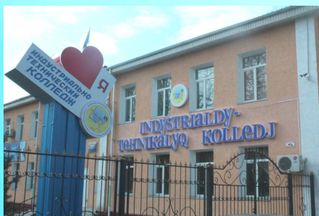
Мемлекеттік шәкіртақы төленеді